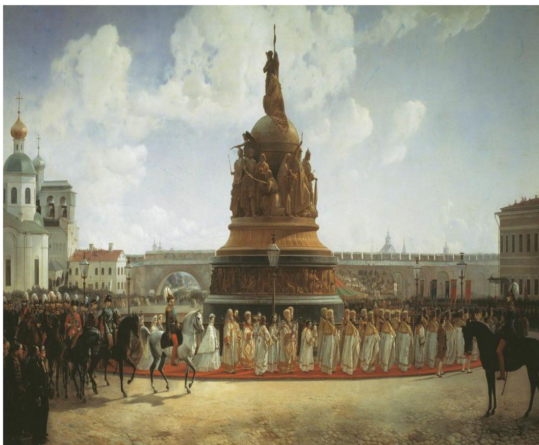
Художник Готфрид (Богдан Павлович) Виллевальде (1819–1903). Открытие памятника «Тысячелетие России» 8 сентября 1862 года.

Первая глава этой книги посвящена периоду с начала XVII столетия и до середины XIX века. За те времена на присоединённых к Московскому государству его юго-восточных окраинах окончательно оформился особый — историко-археологический пласт фольклорного сознания , тип массовых настроений по отношению к памятникам далёкой старины (курганам, городищам, кладам и всем прочим). Эта сторона обыденного сознания и поведения русского народа, прежде всего крестьянства, расценивается ниже как первый — донаучный, или же фольклорный, этап освоения национальной истории.