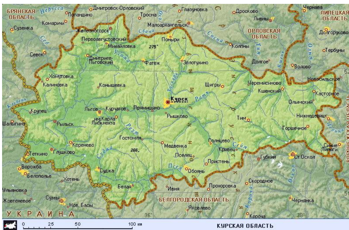
Физико-географическая карта Курской области.

мизматика или топонимика) сохраняют с ней более тесное взаимодействие. В итоге возобладало уточнённое значение археологии как «науки, изучающей древнейшие этапы истории путём исследования памятников материальной культуры» 12 . Поэтому основное внимание в моей работе уделено находчикам, публикаторам и толкователям именно археологических в современном смысле памятников Курского и сопредельных ему краёв. Вместе с тем более или менее подробно затронуты собственно исторические, этнографо-антропологические, архивные, филологические, естественнонаучные аспекты здешней старины.