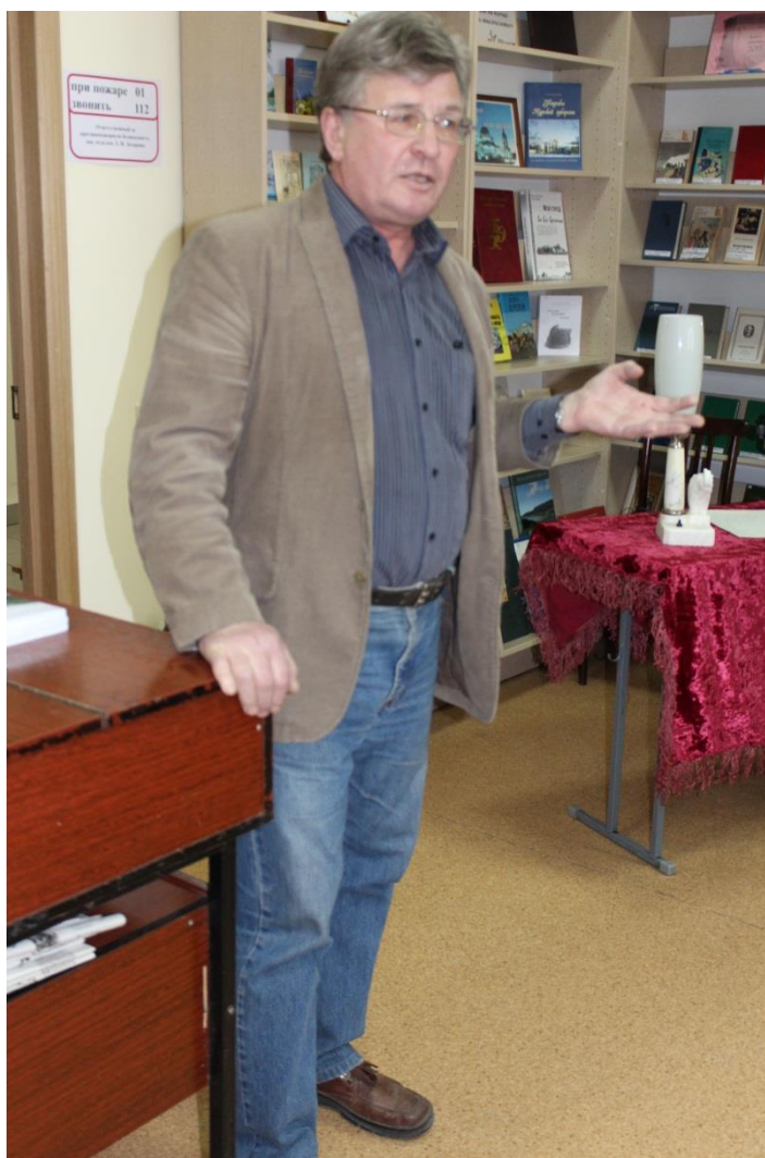
Автор агитирует за краеведение перед студентами КГМУ. 2010-е годы.

Часть этих работ была поддержана исследовательскими грантами Российского гуманитарного научного фонда 21 .