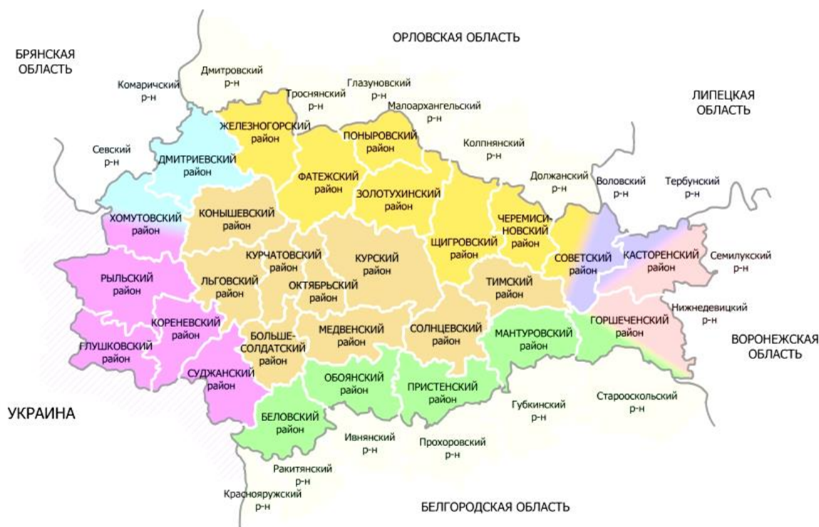
Карта административного деления Курской области РФ.