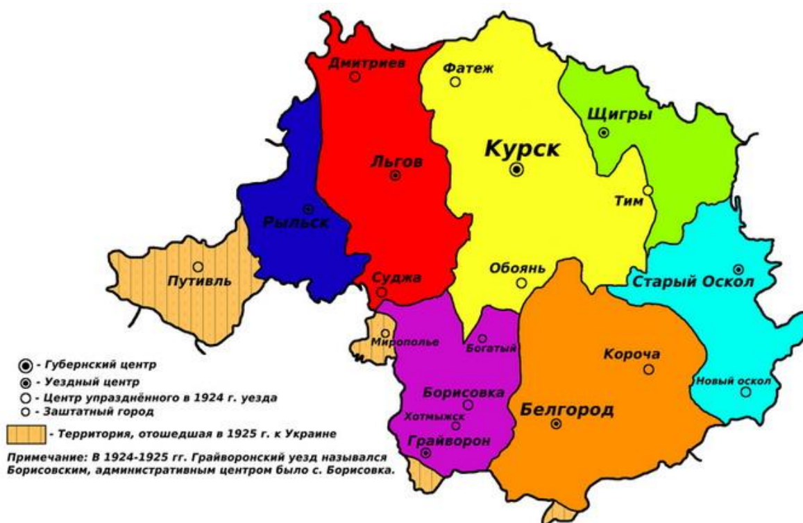
Курская губерния и её уезды в хронологическом промежутке между Российской Империей и СССР. Карта-схема из русскоязычной Википедии.

архитектурным, архивным); генезис, эволюция, вариации этого отношения на протяжении XVII–XX веков; взаимодействие столичных центров и периферии на поприще древлеведения. Прослеживаются разные, но взаимосвязанные стороны освоения региональных древностей — как духовно-теоретическая (исследовательская — научно-академическая и любительско-краеведческая), так и предметно-практическая (поисковая, инвентаризационная, охранно-реконструктивная, музеефикационная, дидактико-педагогическая, просветительно-пропагандистская).