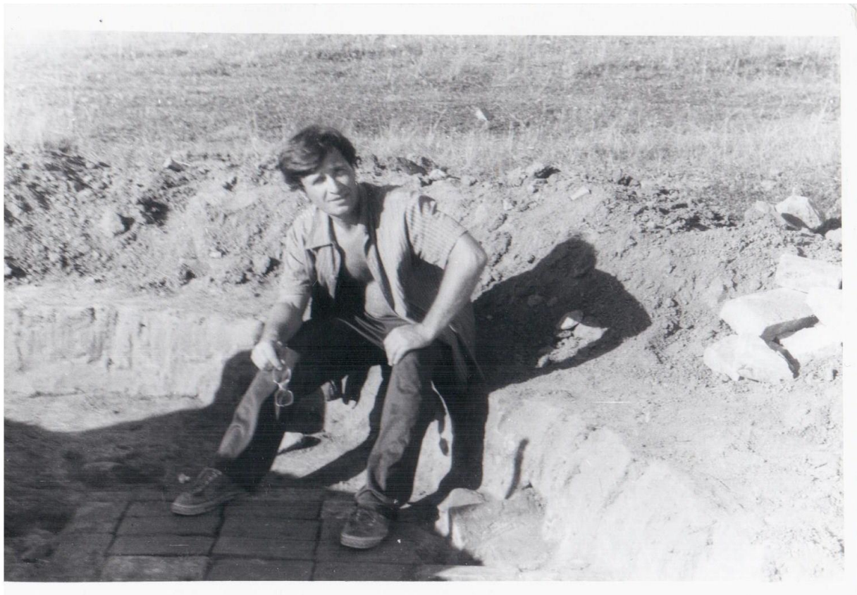
Автор на раскопках курганной группы в селе Артюшкове Рыльского района Курской области экспедицией В.В. и О.Н. Енуковых. 1994 год.

разделена на: предисловие; введение; 4 главы, соответствующие основным периодам региональной историографии и включающие в себя в общей сложности 15 параграфов, в которых чередуется рассмотрение явлений и событий, институтов и персоналий; заключение; приложения — те публикации автора последних лет, что так или иначе относятся к теме этого издания.