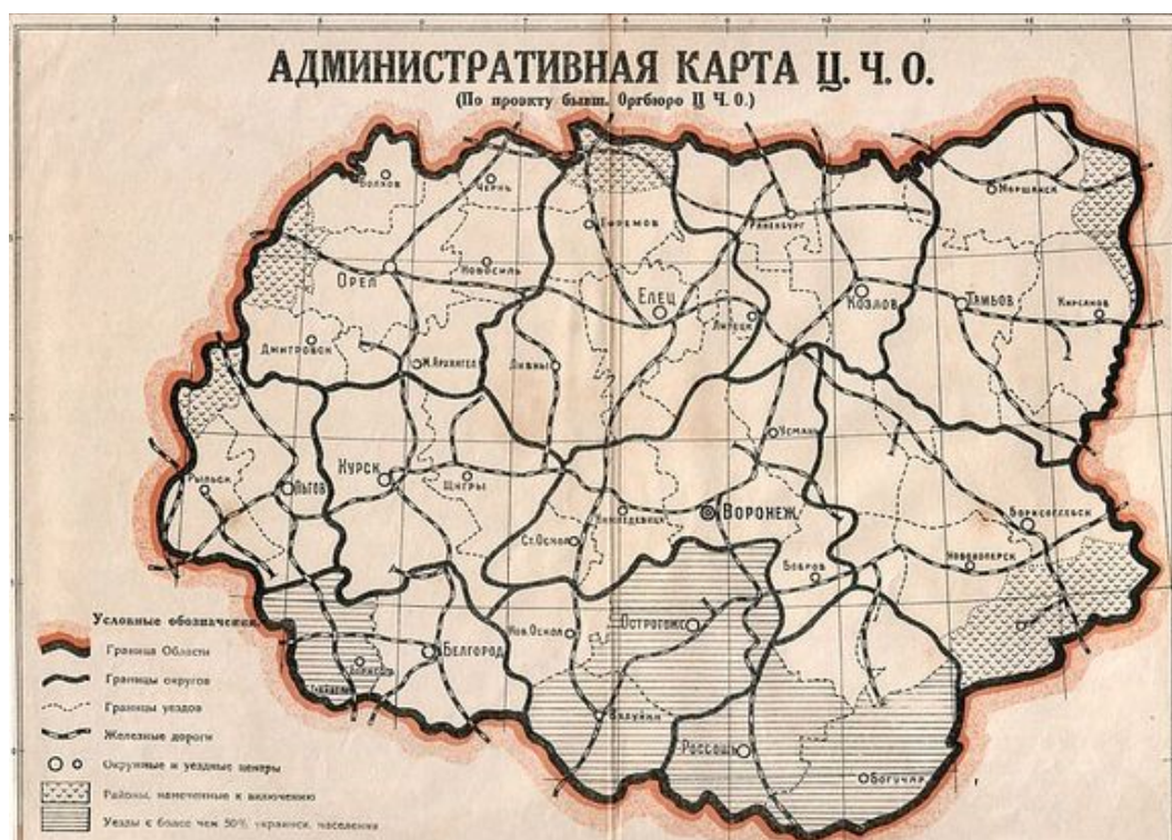
Курский край в составе Центральной Чернозёмной области СССР. Репродукция из кн.: Энциклопедический словарь ЦЧО (Воронеж, 1934).

Н.И. Костомаров в 1875 году полагал «археологическим занятием» «чтение старых бумаг»; «археологом-юристом» слыл известный правовед и архивист Н.В. Калачов; «археологом русского слова» звался виднейший наш фольклорист А.Н. Афанасьев; и т.д.