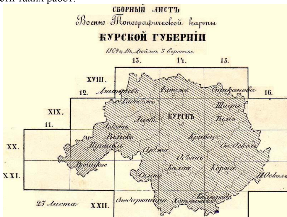
Курская губерния и её уезды на военно-топографической карте Российской империи 1864 года.

Названные сюжеты далеко не исчерпывают тематического репертуара исследований общественно-политического и этнокультурного значения отечественных древностей, но дают независимое представление об актуальности таких работ.