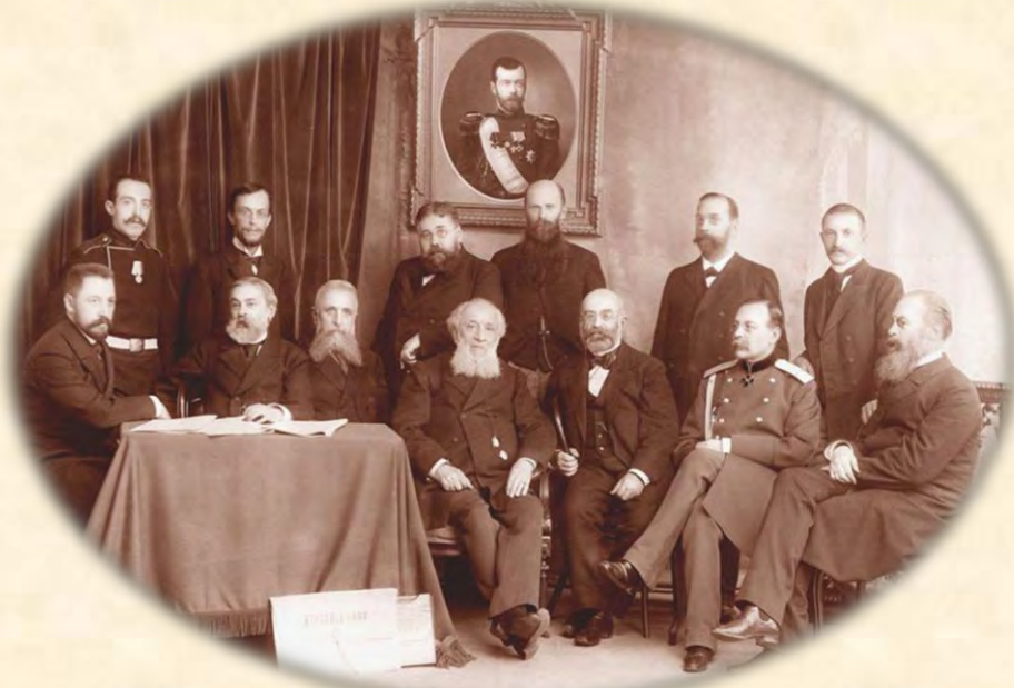
Состав членов комиссии Первой Всеобщей переписи населения

Обширность нашей страны, разнообразие ее географических и экономических условий, слабую ее заселенность, отсутствие удовлетворительных путей сообщения, крайнюю пестроту в этнографическом составе населения, низкий уровень народного развития, ничтожность процента грамотных, предубеждение масс народа против собирания всякого рода данных и пр.,... это трудно устранимые препятствия, на какие может натолкнуться будущая всенародная перепись.» 6