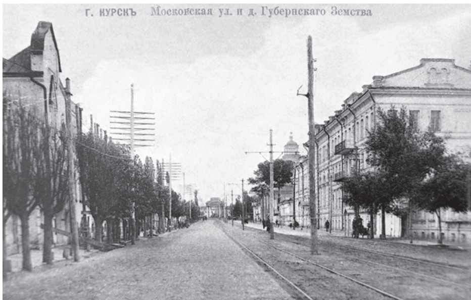
Московская улица и дом Курского губернского земства. 1914 г.