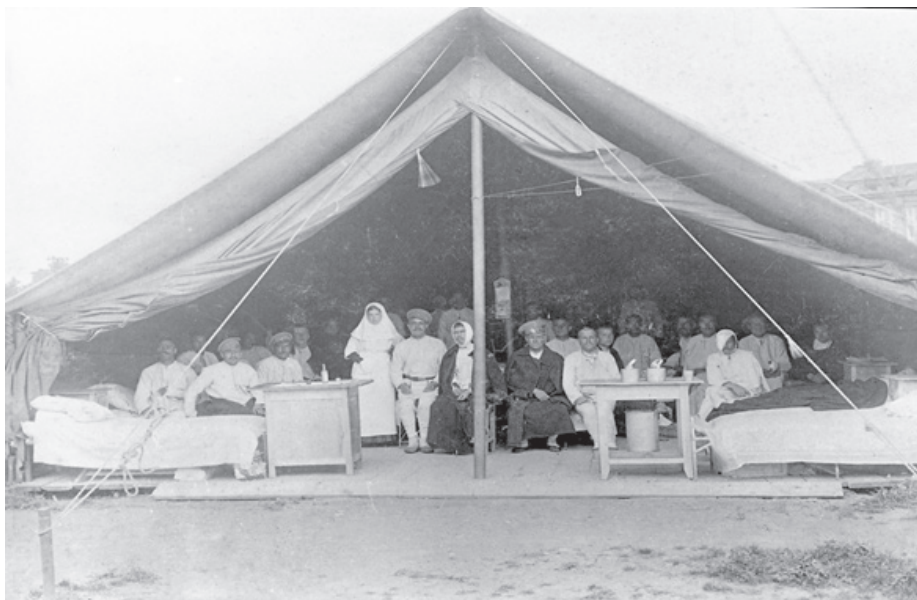
Общий вид полевого госпиталя Первой мировой войны. г. Курск. 1914–1918 гг.