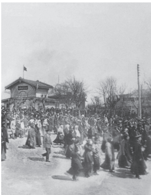
Возле городского сада купеческого собрания в г. Курске. 1917 г.