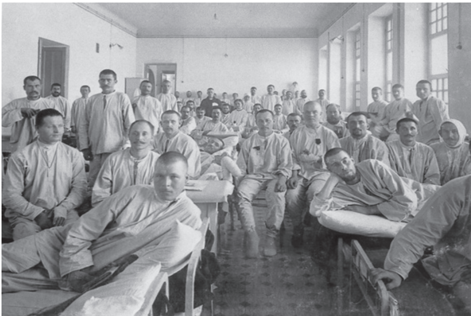
В одной из палат хирургического госпиталя, располагавшегося в здании Народного дома. 1914–1918 гг.