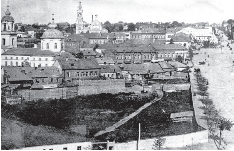
Вид центральной части г. Курска со стороны Знаменского монастыря. 1917 г.