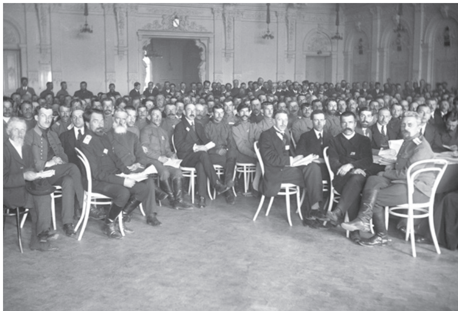
Зал Курского дворянского собрания. Собравшиеся слушают чтение акта об отречении Николая II от престола. 1917 г.