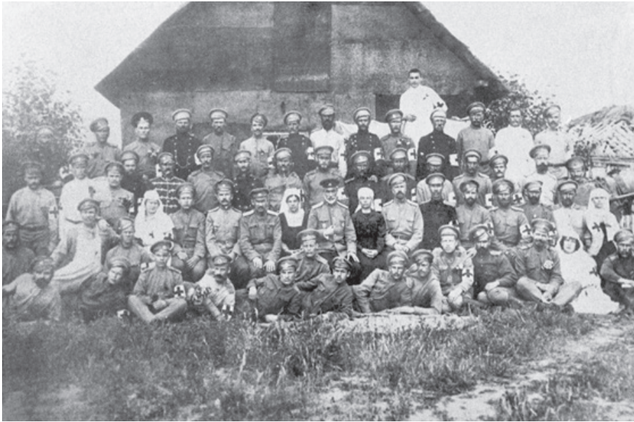
463-й полевой подвижной госпиталь Юго-Западного фронта, сформированный в г. Курске. 1914 г.