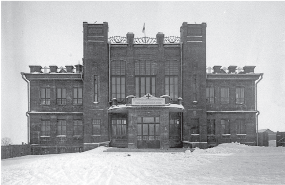
Общий вид хирургического госпиталя в г. Курске, располагавшегося в здании Народного дома. 1914–1918 гг.