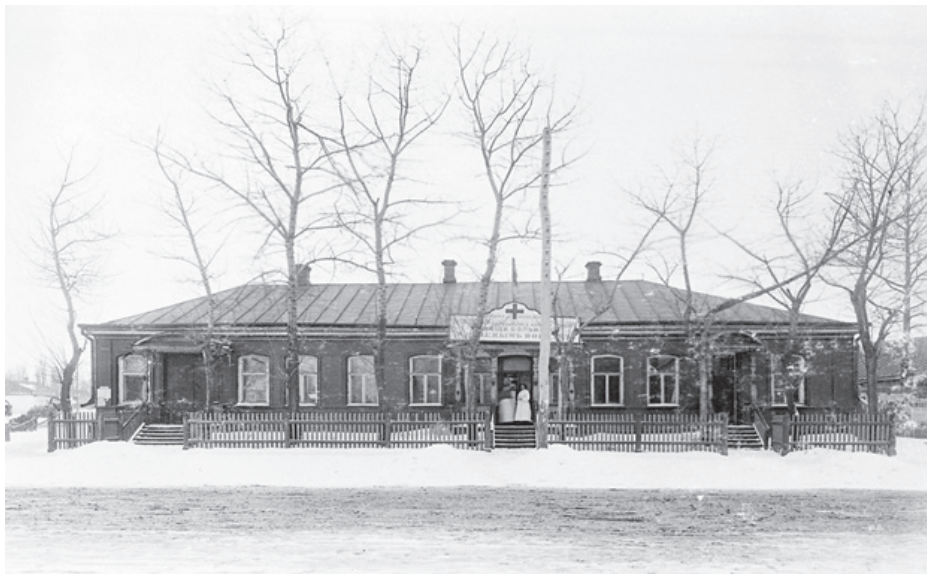
Общий вид заразного барака №1 в г. Курске. 1914–1918 гг.