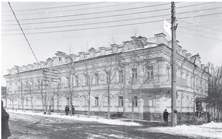
Общий вид здания лазарета купца Н.Н. Гладкова в г. Курске. 1914–1918 гг.