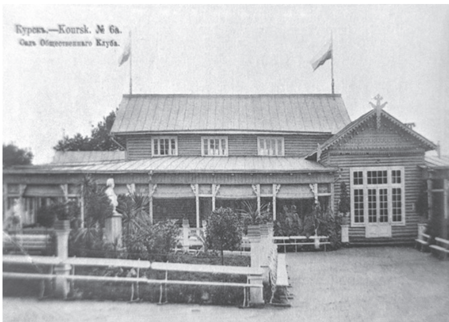
Сад общественного клуба в г. Курске. 1916 г.