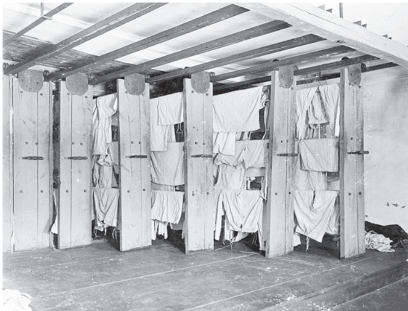
Внутренний вид помещения для сушки белья в прачечной заразного барака №1 в г. Курске. 1914–1918 гг.