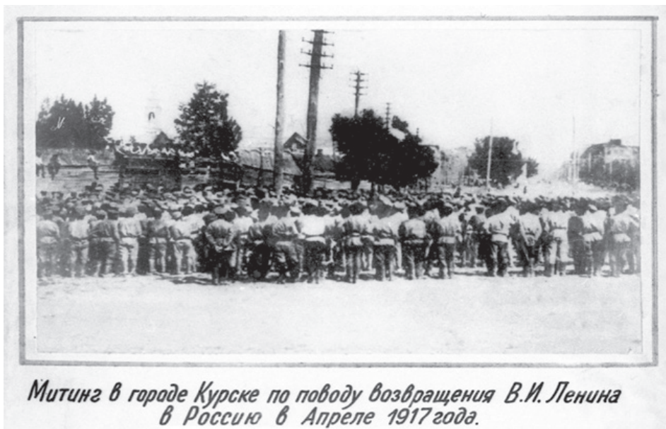
Митинг в городе Курске по поводу возвращения В.И. Ленина в Россию в Апреле 1917 года.