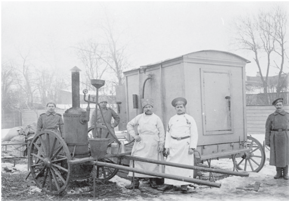
Передвижная дезинфекционная камера периода Первой мировой войны. г. Курск. 1914–1918 гг.