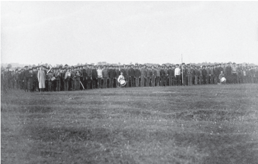
Учащиеся городской школы во время обучения. г. Курск. 1915–1916 гг.