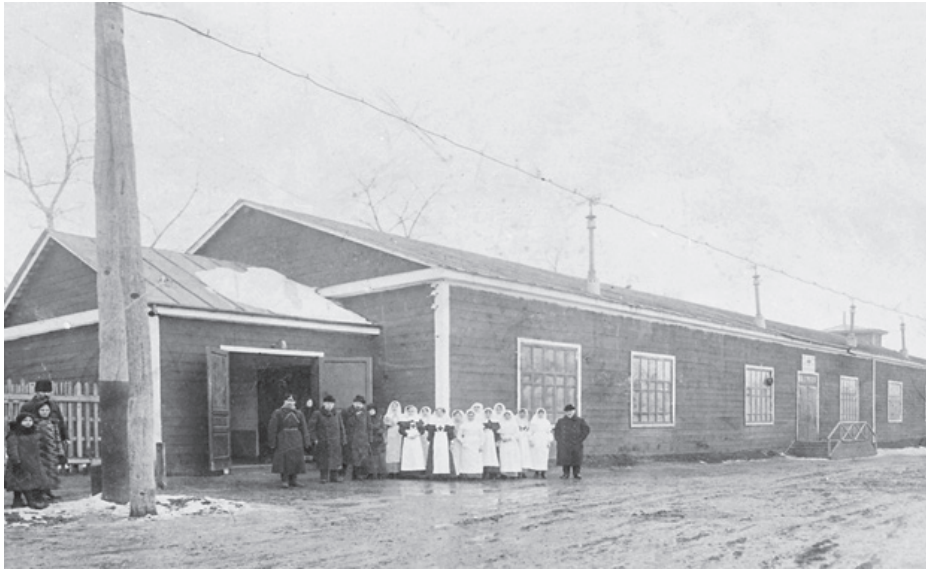
Общий вид заразного барака №1 в г. Курске. 1914–1918 гг.