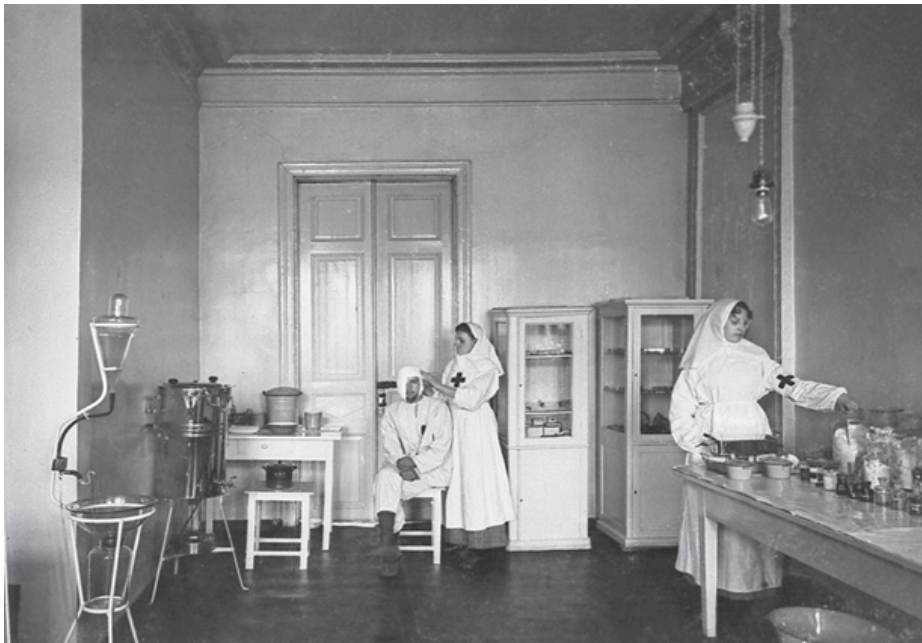
Внутренний вид помещения для сушки белья в прачечной заразного барака №1 в г. Курске. 1914–1918 гг.