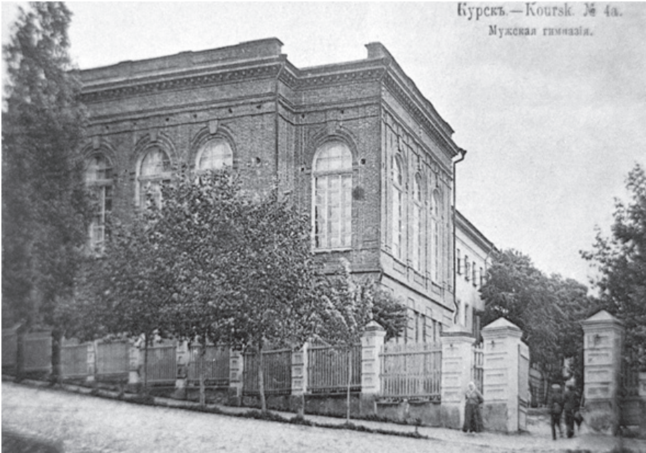
Мужская гимназия. г. Курск. 1915 г.