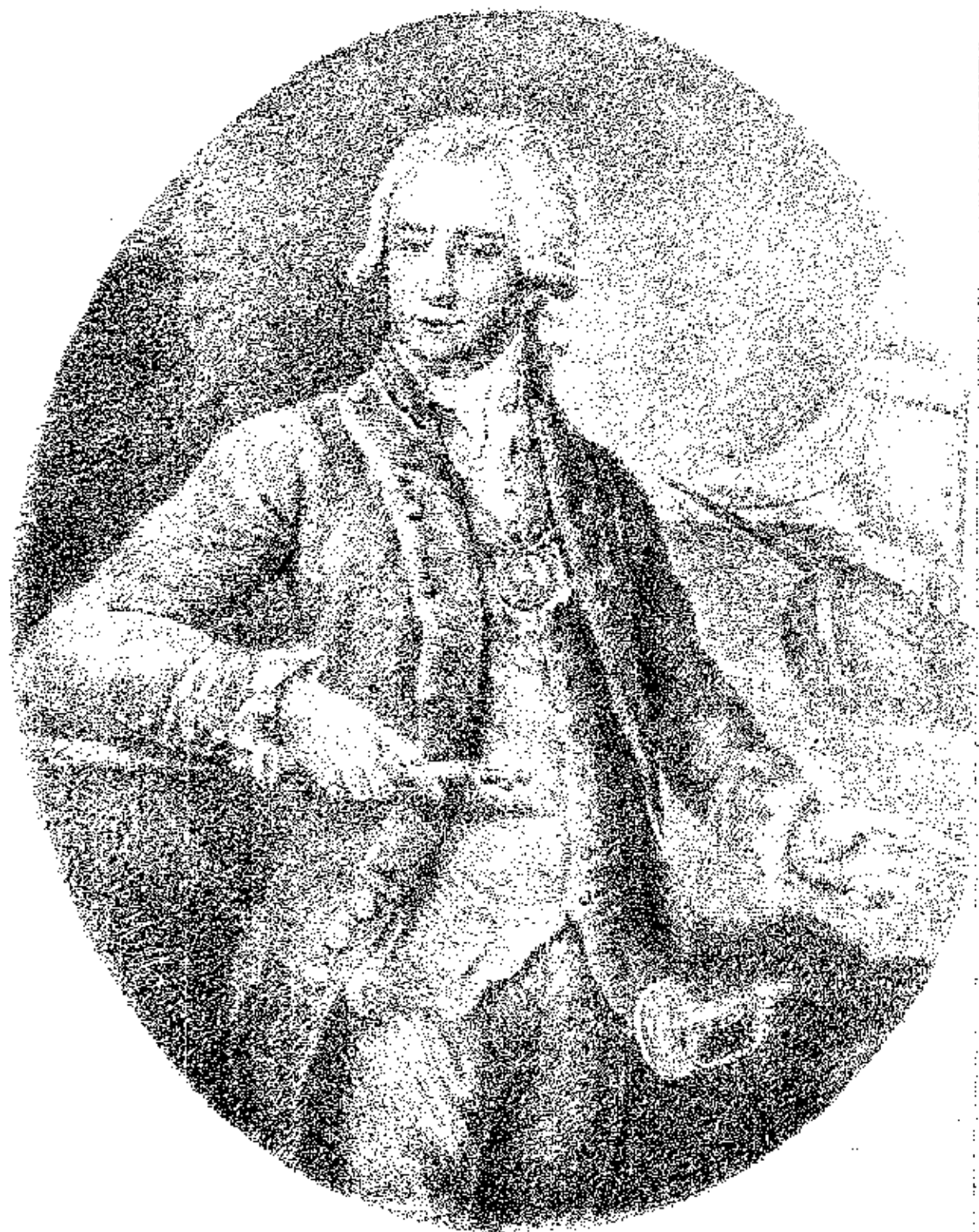
Григорій Іванович Шелеховъ

(род. 1747 г. з. смерч. 20 іюля 1795 г.)